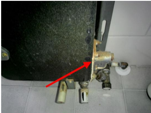
Afvoerkolom (Pakking gevelkachel 2)