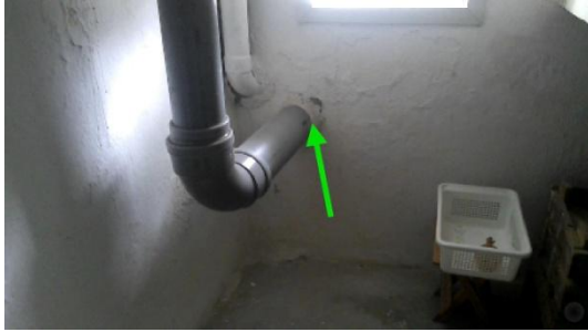
Afvoerkolom (Afvoerkolom 4)