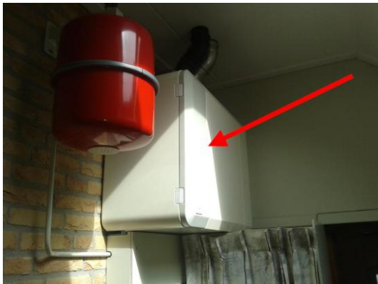
VAILLANT MAG C 13 (VAILLANT MAG C 13 T1)