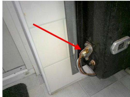
Afvoerkolom (Pakking gevelkachel 2)