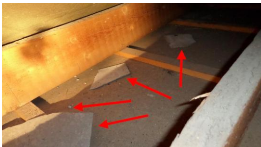
Asbestrestanten (Asbestrestanten 3)